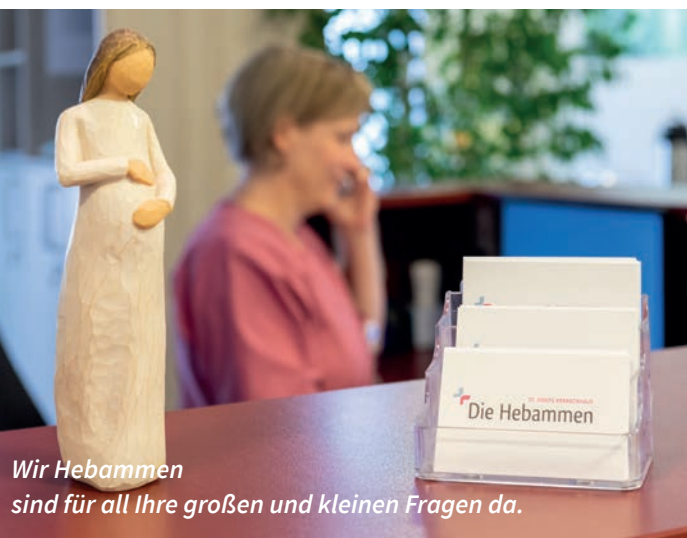
Wir Hebammen sind für all Ihre großen und kleinen Fragen da.

Als Team von freiberuflichen Hebammen arbeiten wir im 12-Stunden-Dienst mit einer zusätzlichen Rufbereitschaft. Durch unser Dienstbelegschaftssystem können wir einen Betreuungsschlüssel von 1:1 / 1:2 während der Geburt gewährleisten. Wir kooperieren gut und gern mit unserem ärztlichen Team sowie den Kinderkrankenschwestern und Hebammen der Wochenbett-Station.